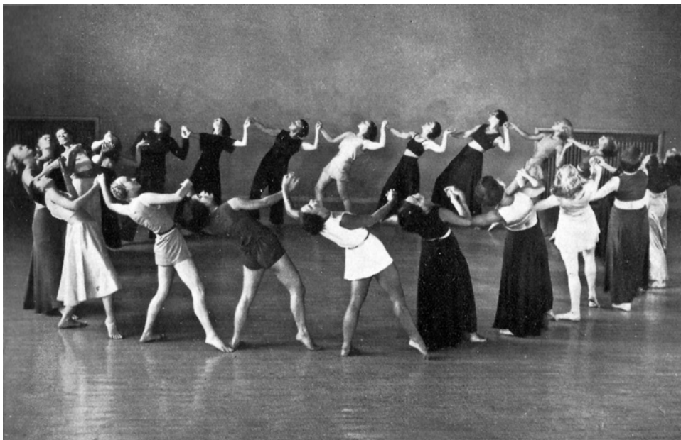
Chórický pohyb (etuda), choreografie Mary Wigmanová. Mary Wigman. Deutsche Tanzkunst . Dresden: Carl Reissner, 1935, fotografická příloha, s. 13.